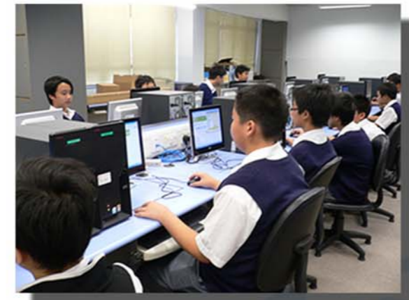
電腦輔導學習室 (Computer-Aided-Learning Room)

學生更可在新落成的語言研習室(Language Laboratory)及電腦輔導學習室(Computer-Aided-Learning Room)，透過系統，與不同的同學組合，有效地進行語音訓練；也可利用視像伺服器，進行不同步、互動的視像學習。