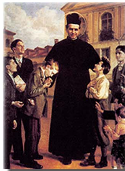
創辦人 鮑思高神父