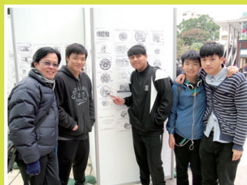
多謝子華及義工組到場支持