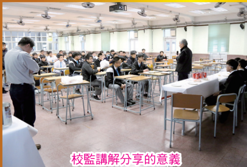
校監講解分享的意義