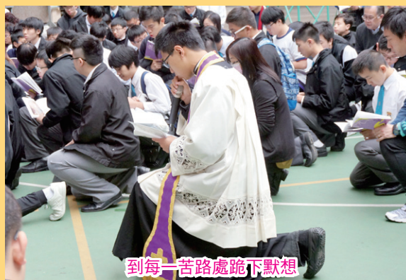
到每一苦路處跪下默想