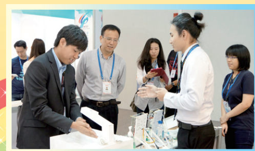
頌軒和他的IVE戰友在廣州參賽，正在示範他們的「智能水龍頭」。