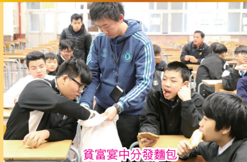
貧富宴中分發麵包