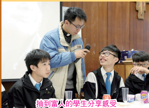
抽到富人的學生分享感受