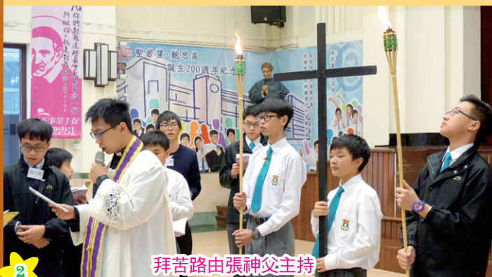
拜苦路由張神父主持