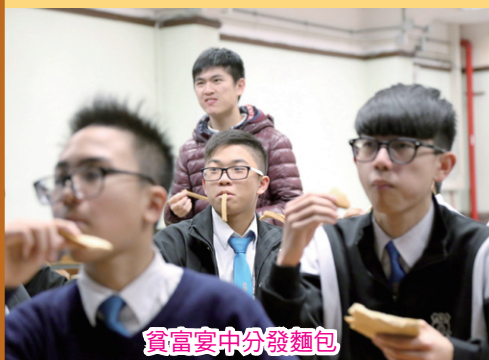
貧富宴中分發麵包