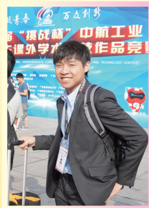
頌軒重披美國賽的戰衣