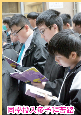
同學投入參予拜苦路