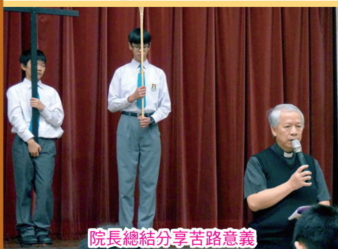
院長總結分享苦路意義