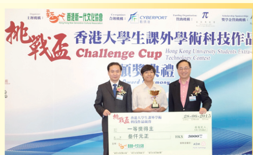
頌軒獲創科局局長楊偉雄先生頒發「一等獎」。