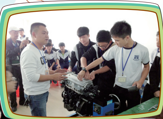
同學上引擎修課，親手拆裝