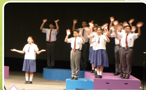
實況劇場道出天主教學校的老師要將真理、公義、愛、生命和家庭的價值傳授給每一個學生