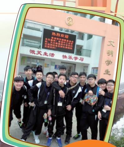
海南省機電工程學校宿舍門前合照