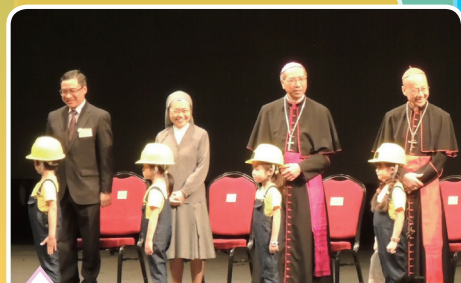
香港天主教修會學校聯會主席余立勳校長、古修女、夏志誠輔理主教及湯漢樞機主持啟動禮

天主教學校教師日於5月17日假亞洲博覽館舉行。當天主題是「我是道路、真理、生命」，就是在天主的引導下，讓學生認清自己的「道路」，明白「真理」，熱愛「生命」，健康快樂地成長。夏志誠主教引用朱自清的一句說話：「做老師本身是一種信仰。」即相信人是性善的，可教的，通過教育去改變一個人，做到移風易俗。正如耶穌受難時仍相信天主，仍相信人是善的。最後，夏主教更希望在場一萬二千名老師學習耶穌，把「我是道路、真理、生命」這句說話成為信仰，化為動力，在教育的道路上引導學生，以生命影響生命，不放棄每一個學生。