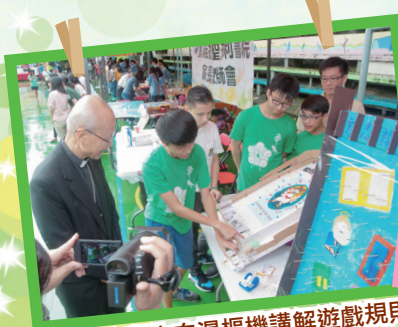
本校學生向湯樞樞機講解遊戲規則