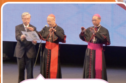
湯漢樞機主教派遣禮、承諾及降福禮