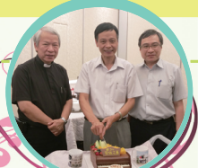
鄭老師與林神父及校長一同合照