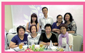
香工前家長理事與現屆家長理事合照