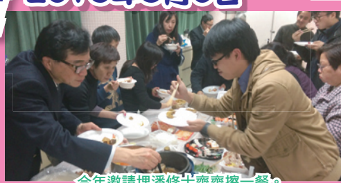
今年邀請理潘修士齊齊擦一餐。