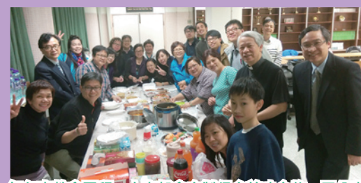
每年家教會團拜，大家都會自製很多美味食物一同分享。