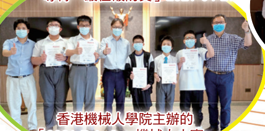
香港機械人學院主辦的 「2021 Robofest 機械人大賽」