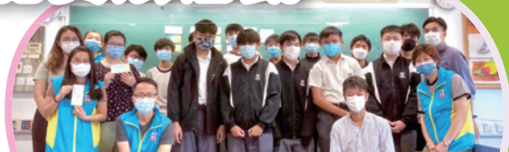
豐香港社區夥伴計劃 2020「繽紛種子」 義工訓練 2021-05-25