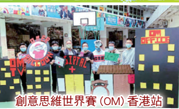
創意思維世界賽 (OM) 香港站