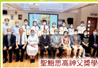
聖鮑思高神父獎學金