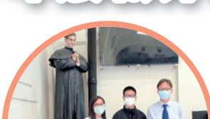
2020 年分區優秀學生 (高中組) (南區) 殊榮