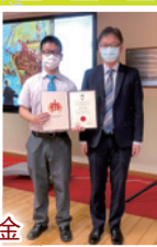
Metomics 兩岸四地 STEM 大賽 (香港賽區)