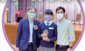
公益少年團舉辦的「筆記本封面設計比賽」