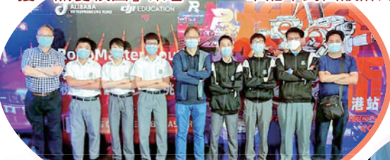
Robomaster 2020 機甲大師青少年挑戰賽 奪得「最佳破防獎」2021-04-27