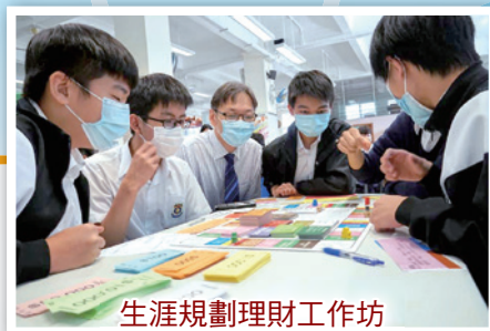
生涯規劃理財工作坊

香港這兩年間，在疫情的籠罩下，各行各業都受到不同程度的影響，其中學生的上課同時亦受到很嚴重的影響，尤其是中六的學生。他們要面對公開試的壓力，比往年的考生都大。2020年的公開考試，延期了差不多一個月，考生甚至擔憂未能應考。除了考試之外，他們在升學的路途上，也受到疫情的負面影響，不知道是否能夠趕及報讀各大專院校的截止日期。故此，他們的情緒或多或少都受到了影響，特別需要老師的協助及輔導。自2020年2月開始，疫情影響下突然停課，中六學生連畢業考試也未能完成，便立即要停課。跟著連騰餘的考試也要在家中進行。因此升學輔導工作方面，學生每有疑問都要透過網上渠道進行，如 whatsapp、電子郵件等等。這對學生來說，無疑是很方便，但對老師來說，也是一種沉重的負擔。因為與面對面輔導比較，透過電子方式進行，效率比較低。有時也搞不清楚學生的問題，要反覆詢問，才能滿足他們的需要。此外，這種方式，老師差不多要24小時 stand-by 一樣，學生隨時有問題，老師便要盡快回應，以解決他們的需要。當然這種方法也有好處，就是可以直接將網頁的連結發給他們，快速直接。透過這種方式溝通，也可增進與學生之間的關係，更能亦師亦友。