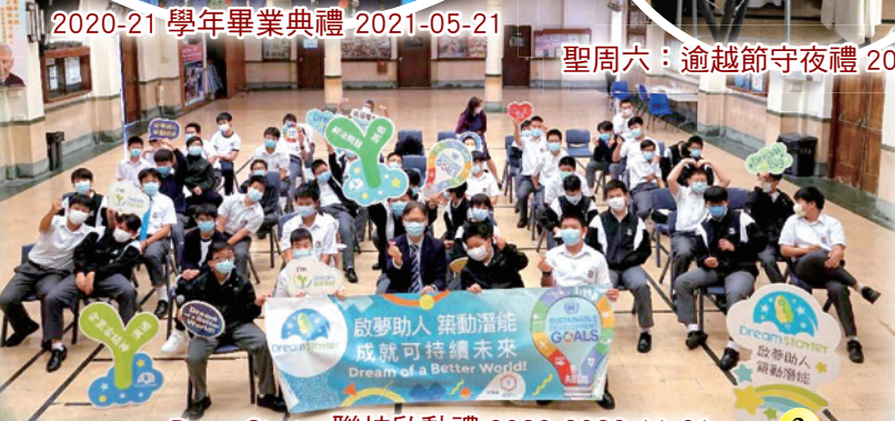
DreamStarter 聯校啟動禮 2020-2020-11-01