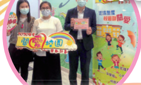
「關愛校園獎勵計劃」中獲「關愛校園」榮譽