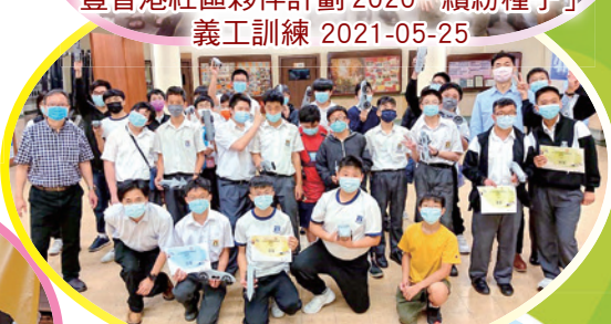
英國迷你火箭車比賽