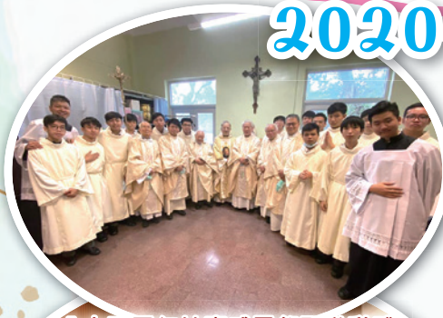
八十五周年校慶感恩祭暨啟動禮